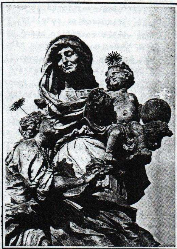
Sousoší sv. Anny na Karlově mostě v Praze

Občasník ZPRAVODAJ vydala Charita v Katovicích - rok 1997